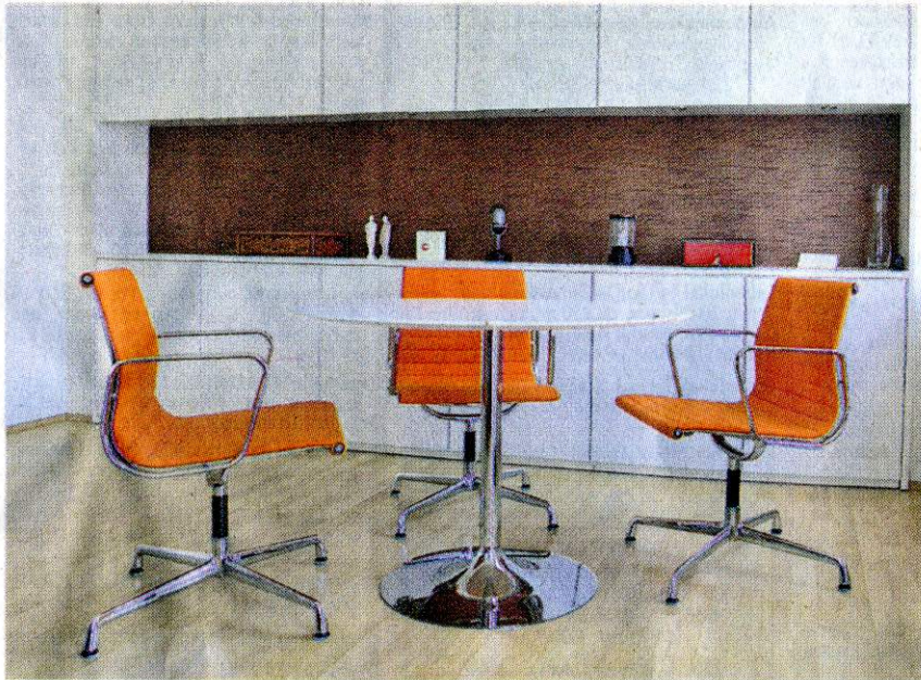
Schlicht und seriös: die Besprechungsecke eines Anwaltsbüros.

KÖLNER STADTANZEIGER SAMSTAG 19.09.2009, - IMMOBILIEN